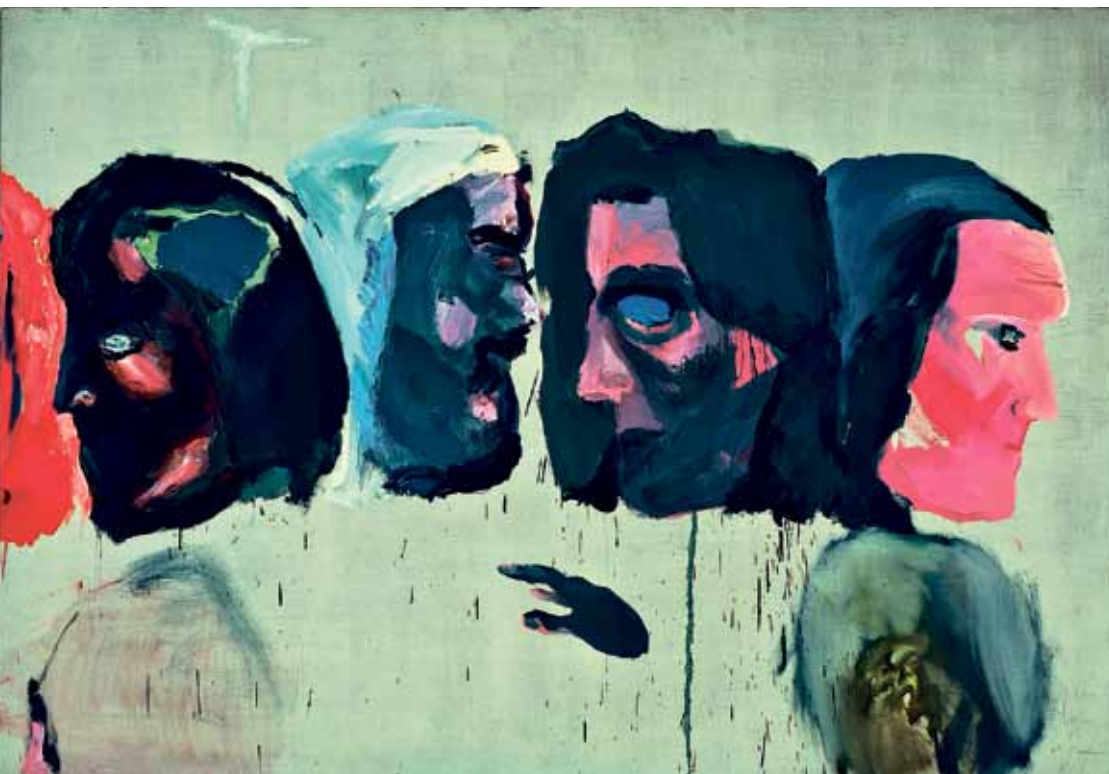
Ostatnia wieczerza, 1987, olej/plótno, 140x400