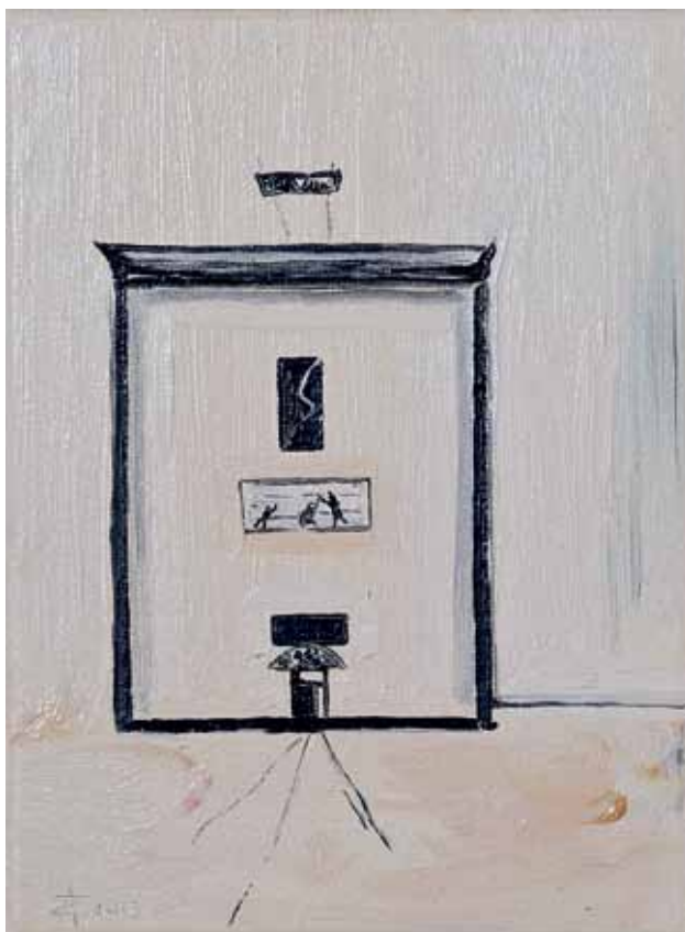
Stracenie ideału, 2013, olej/plótno, 24x18