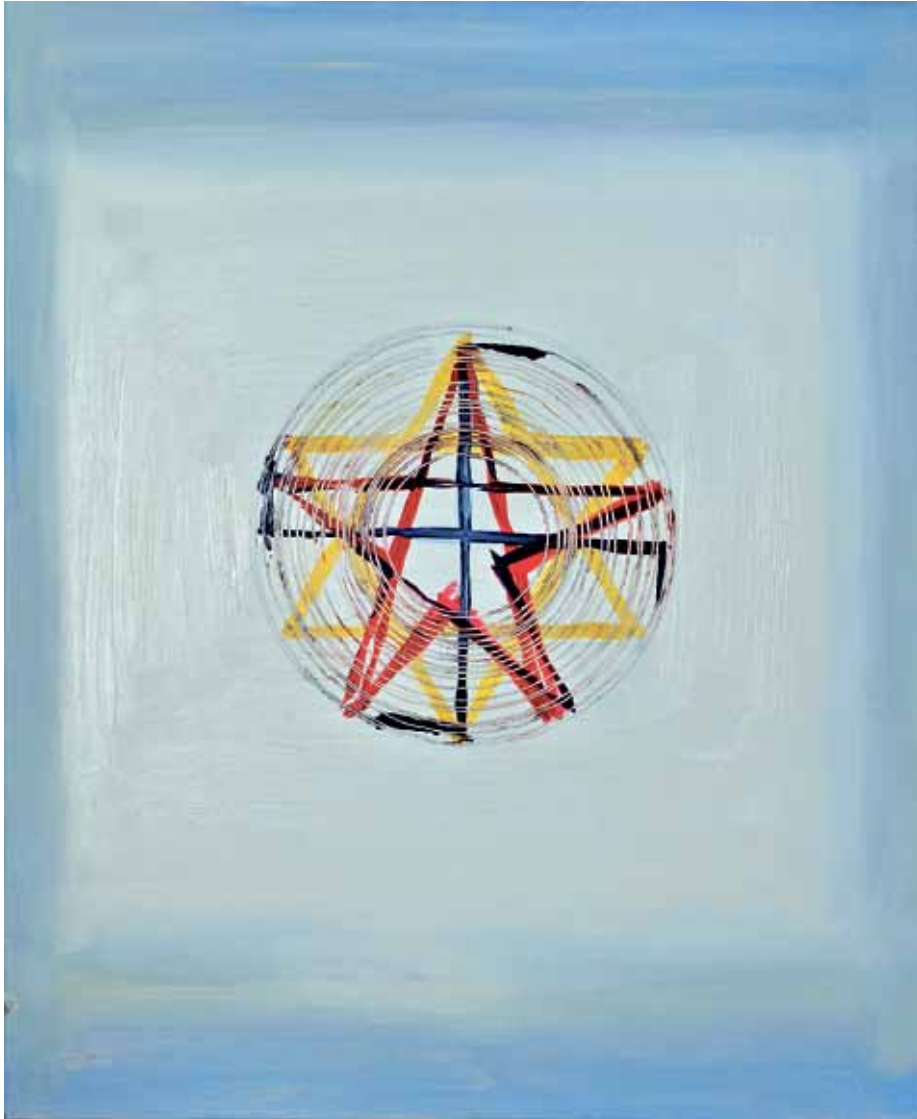
Dezintegracja pozytywna – stroik, 2011, olej/plótno, 140x114