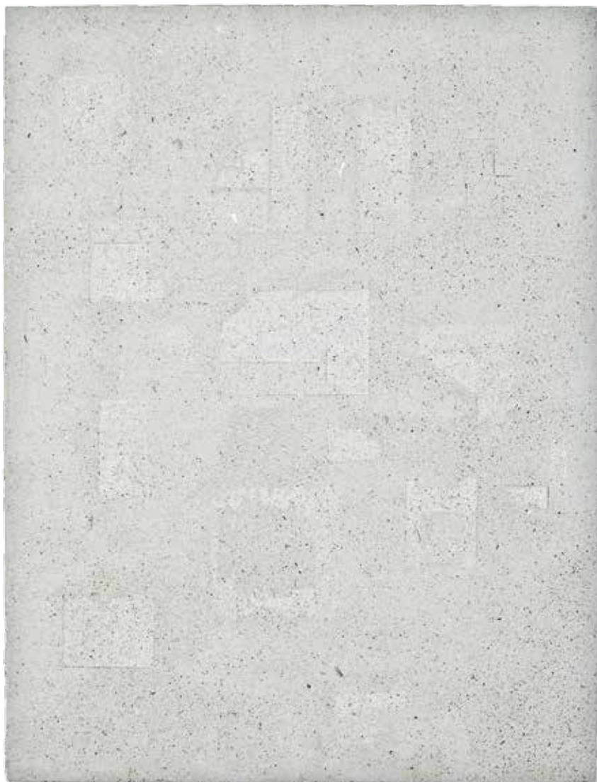
Obraz Autonomiczny nr 17, lateks, akryl, drewno, sklejka, 63x48x5, 2014