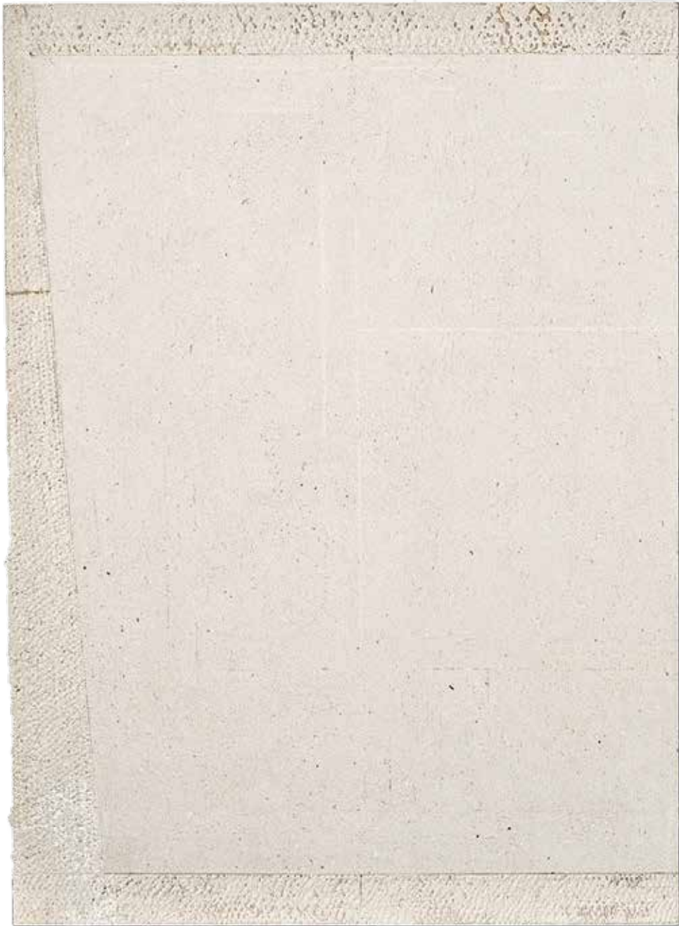
Obraz Autonomiczny nr 29, lateks, akryl, drewno, sklejka, 160x240x5, 2014