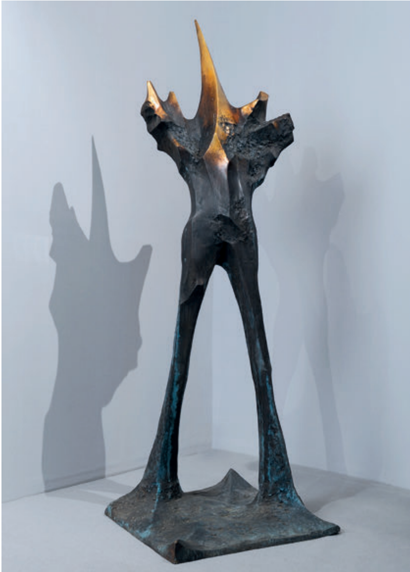
Z cyklu „Figury”, 2001, brąz, 190x80x80