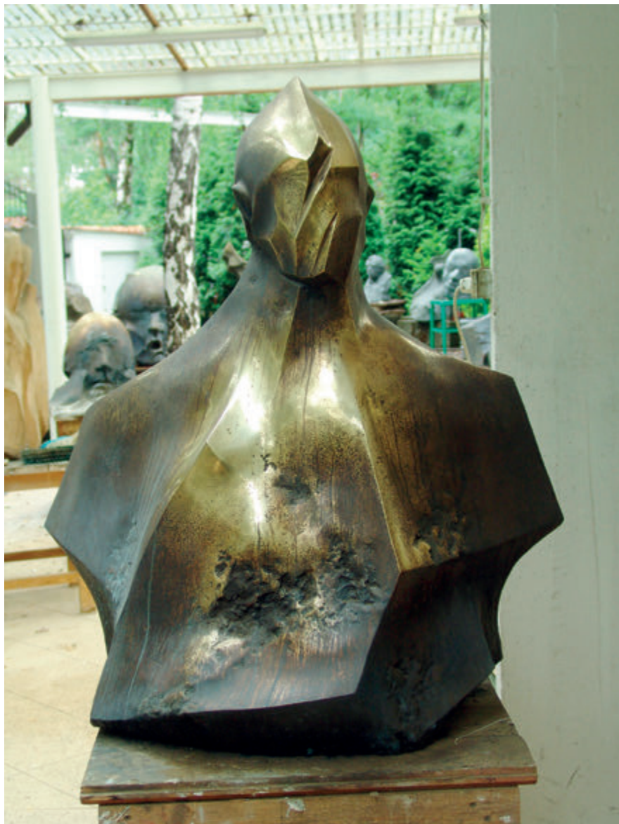
Z cyklu „Nadzieja”, 2010, brąz, 100x90x60