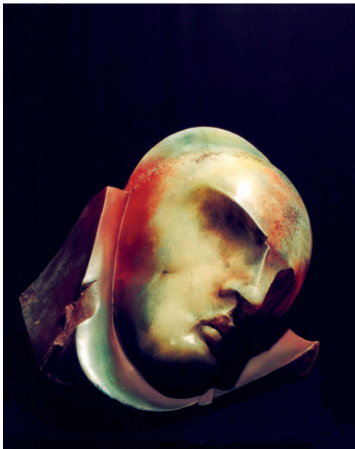
Z cyklu „Sen”, 1988, stiuk polichromowany, 70x70x60