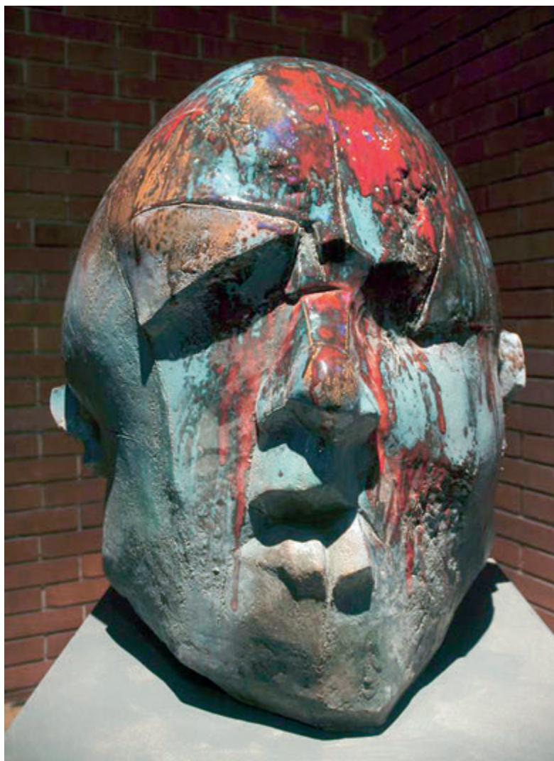
Z cyklu „Sen”, 2015, terakota, 80x60x60