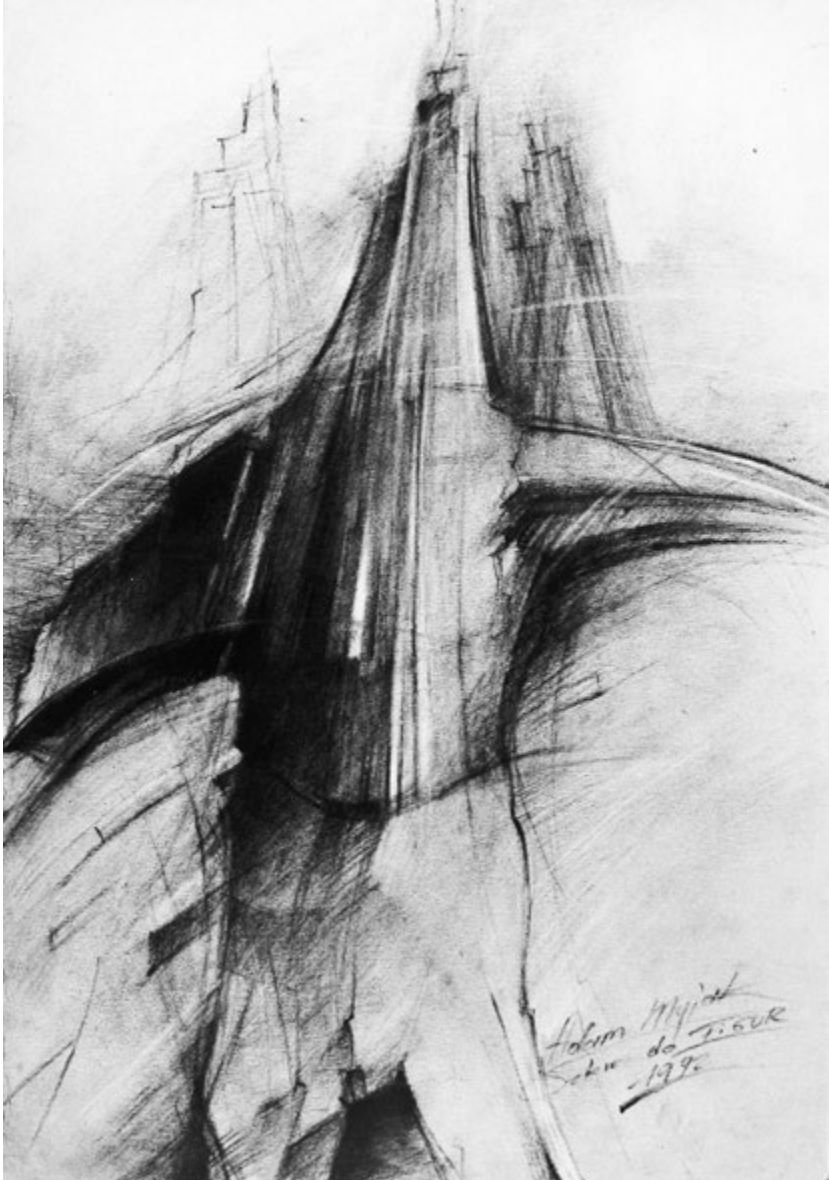
Szkic do „Figur”, 1992, rysunek węgłem, 70x50