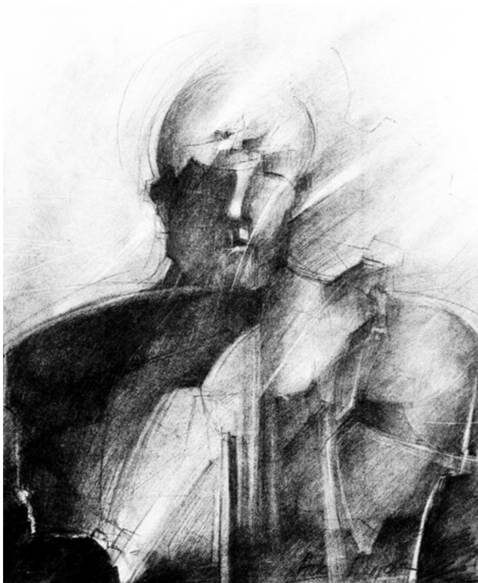
Rysunek węglem, 1985, 70x50