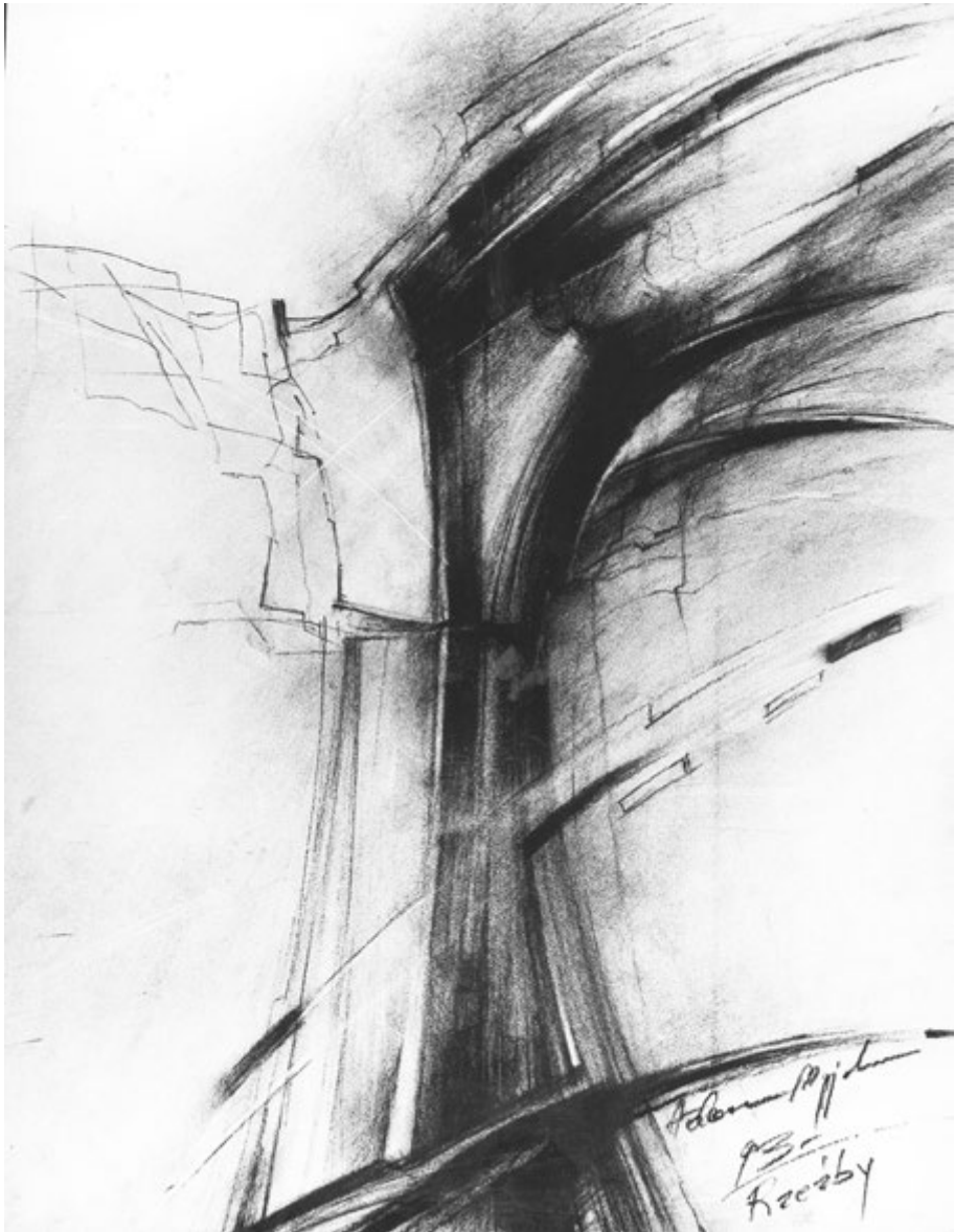
„Rzeźby”, 1993, rysunek węglem, 70x50